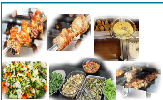
Restaurante Menino - de saladas a carnes Tudo delicioso - é só levar a família e almoçar