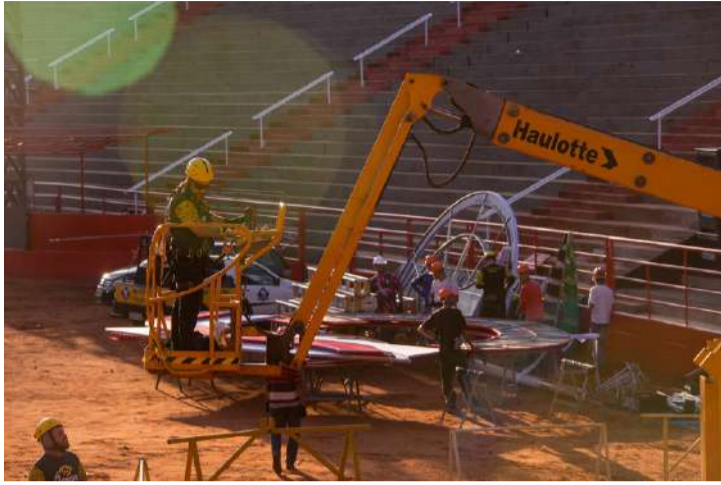
Evento acontece de 18 a 28 de agosto, no Parque do Peão

Complexo deve receber 900 mil visitas de 18 a 28 de agosto