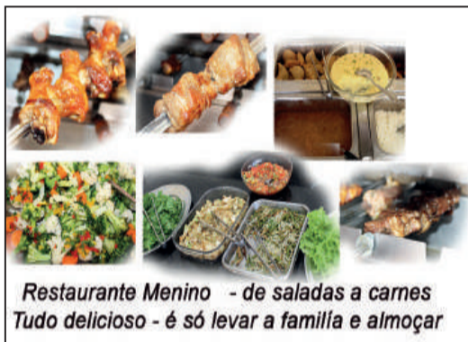
Restaurante Menino - de saladas a carnes Tudo delicioso - é só levar a família e almoçar