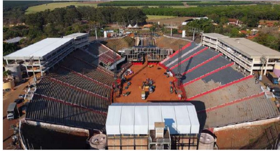
Movimentação toma conta do Parque do Peão na reta final da 65ª Festa do Peão de Barretos

Na reta final para os preparativos da 65ª Festa do Peão de Barretos, a movimentação toma conta do Parque do Peão. O complexo de 2 milhões de metros quadrados que sediará o maior evento do gênero da América Latina, deve receber cerca de 900 mil visitas de 18 a 28 de agosto. Os organizadores aguardam grande parte dessa movimentação já para a primeira semana.