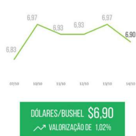
Comparativo - 07/10 (sexta-feira) e 14/10 (sexta-feira)