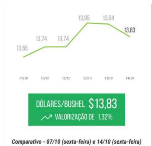
Comparativo - 07/10 (sexta-feira) e 14/10 (sexta-feira)

A China, após retornar da "semana dourada", efetuou a compra de 622 milhões de toneladas, de um total de 724 milhões de toneladas de soja, ficando acima da expectativa do mercado. No Brasil, o plantio segue evoluindo, porém em ritmos mais lentos. De um lado, há chuvas constantes e o excesso de umidade no Sul do Brasil, enquanto do outro, precipitações irregulares e a baixa umidade do solo no Centro-Oeste e Sudeste. Previsões do Centro de Previsões Climáticas (CPC/NOAA), indicam que a influência do fenômeno "La Niña" ocorra já no mês de novembro, causando um alerta sobre a expectativa de produção recorde de 152 milhões de toneladas.