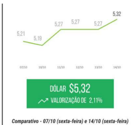
Comparativo - 07/10 (sexta-feira) e 14/10 (sexta-feira)

O dólar teve uma semana de forte valorização, fechando a sexta-feira sendo cotado a R$5,32 (+2,11%). O cenário de incertezas, fortalece a possibilidade de uma recessão mundial, principalmente após a divulgação dos números da inflação norte-americana que veio acima do esperado. Dessa forma, o Banco Central dos EUA, deve manter o aumento agressivo das taxas de juros, favorecendo o dólar globalmente. A alta expressiva do dólar somado a valorização de Chicago, fizeram com que as cotações do mercado brasileiro fechassem a semana com valorização, em relação à semana anterior.