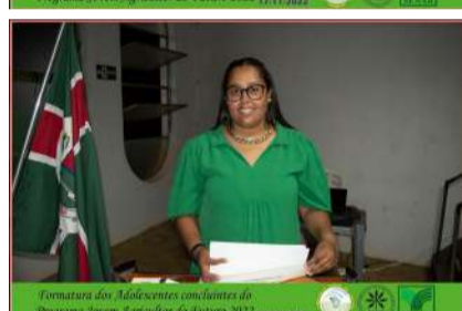
Formatura dos Adolescentes concluintes do Programa Jovem Agricultor do Futuro 2022 17/11/2022