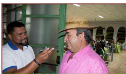
Formatura dos Adolescentes concluintes do Programa Jovem Agricultor do Futuro 2022 17/11/2022