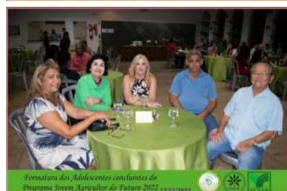
Formatura dos Adolescentes concluintes do Programa Jovem Agricultor do Futuro 2022 17/11/2022