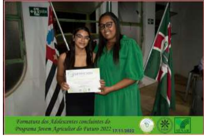
Formatura dos Adolescentes concluintes do Programa Jovem Agricultor do Futuro 2022 17/11/2022