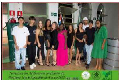
Formatura dos Adolescentes concluintes do Programa Jovem Agricultor do Futuro 2022 17/11/2022