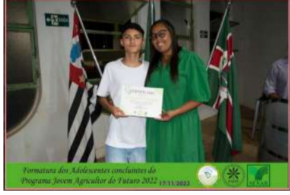
Formatura dos Adolescentes concluintes do Programa Jovem Agricultor do Futuro 2022 17/11/2022