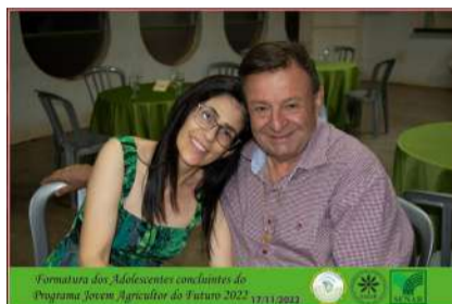
Formatura dos Adolescentes concluintes do Programa Jovem Agricultor do Futuro 2022 17/11/2022