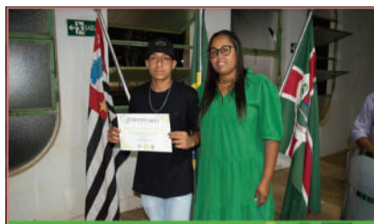
Formatura dos Adolescentes concluintes do Programa Jovem Agricultor do Futuro 2022 17/11/2022