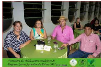
Formatura dos Adolescentes concluintes do Programa Jovem Agricultor do Futuro 2022 17/11/2022