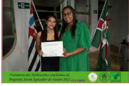
Formatura dos Adolescentes concluintes do Programa Jovem Agricultor do Futuro 2022 17/11/2022