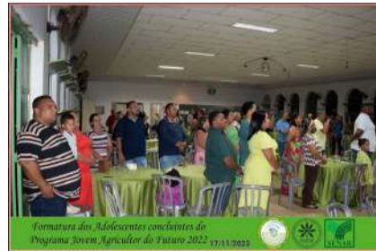
Formatura dos Adolescentes concluintes do Programa Jovem Agricultor do Futuro 2022 17/11/2022