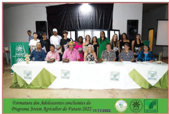
Formatura dos Adolescentes concluintes do Programa Jovem Agricultor do Futuro 2022 17/11/2022