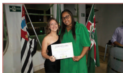
Formatura dos Adolescentes concluintes do Programa Jovem Agricultor do Futuro 2022 17/11/2022