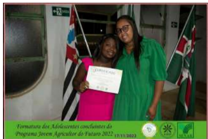
Formatura dos Adolescentes concluintes do Programa Jovem Agricultor do Futuro 2022 17/11/2022