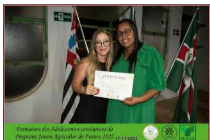
Formatura dos Adolescentes concluintes do Programa Jovem Agricultor do Futuro 2022 17/11/2022