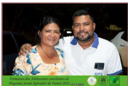
Formatura dos Adolescentes concluintes do Programa Jovem Agricultor do Futuro 2022 17/11/2022