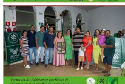
Formatura dos Adolescentes concluintes do Programa Jovem Agricultor do Futuro 2022 17/11/2022