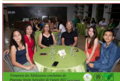
Formatura dos Adolescentes concluintes do Programa Jovem Agricultor do Futuro 2022 17/11/2022