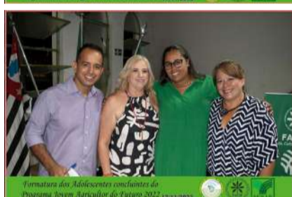
Formatura dos Adolescentes concluintes do Programa Jovem Agricultor do Futuro 2022 17/11/2022