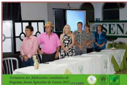
Formatura dos Adolescentes concluintes do Programa Jovem Agricultor do Futuro 2022 17/11/2022