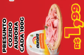
PRESUNTO COZIDO AURORA CADA 100G R$ 1,99