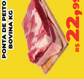
PONTA DE PEITO BOVINA KG R$ 22,99