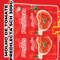
MOLHO DE TOMATE PREDILECTA MOLHO R$ 1,29