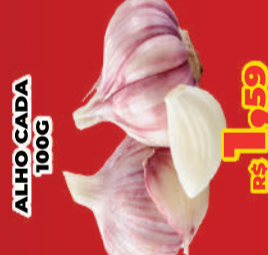
ALHO CADA 100G R$ 1,59