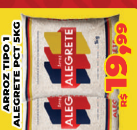
ARROZ TIPO 1 ALEGRETE PCT 5KG R$ 19,99