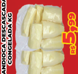
MANDIOCA DESCASCADA CONGELADA KG R$ 5,99