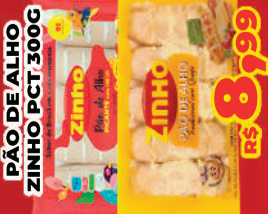
PÃO DE ALHO ZINHO PCT 300G R$ 8,99