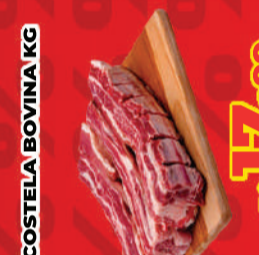
COSTELA BOVINA KG R$ 17,99