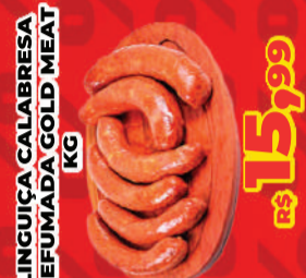
LINGUIÇA CALABRESA DEFUMADA GOLD MEAT KG R$ 15,99