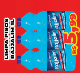
LIMPA PISOS RAJJALIM 1L R$ 5,99