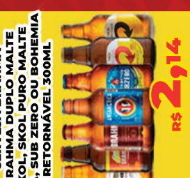
CERVEJA BRAHMA BRAHMA DUPLO MALTE SKOL, SKOL PURO MALTE BOA, SUB ZERO OU BOHEMIA RETORNÁVEL 300ML R$ 2,14