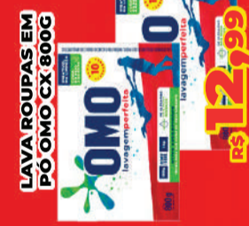
LAVA ROUPAS EM PÓ OMO CX 800G R$ 12,99