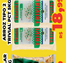
ARROZ TIPO 2 TRIVIAL PCT 5KG R$ 18,99