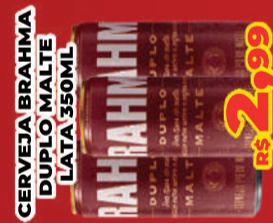
CERVEJA BRAHMA DUPLO MALTE LATA 350ML R$ 2,99