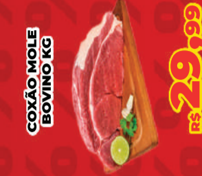
COXÃO MOLE BOVINO KG R$ 29,99