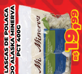
LASCAS DE POLACA DO ALASKA MINERVA PCT 400G R$ 19,99