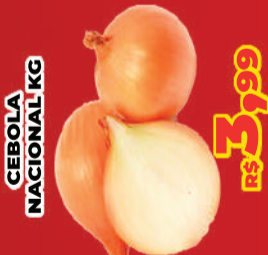
CEBOLA NACIONAL KG R$ 3,99