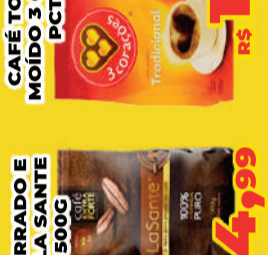
CAFÉ TORRADO E MOÍDO LA SANTE PURO PCT 500G R$ 14,99