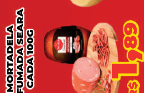
MORTADELA DEFUMADA SEARA CADA 100G R$ 1,89