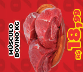
MÚSCULO BOVINO KG R$ 18,99