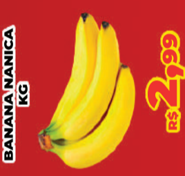
BANANA NANICA KG R$ 2,99