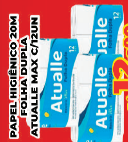
PAPEL HIGIÊNICO 20M FOLHA DUPLA ATUALLE MAX C/12UN R$ 12,99