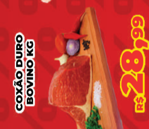
COXÃO DIURO BOVINO KG R$ 28,99