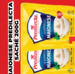
MAIONESE PREDILECTA SACHÊ 200G R$ 1,99