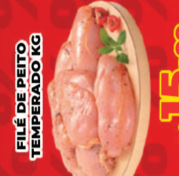
FILÉ DE PEITO TEMPERADO KG R$ 15,99