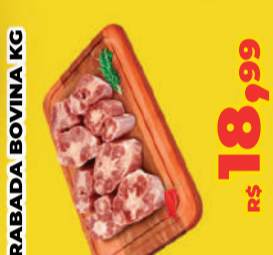
RABADA BOVINA KG R$ 18,99