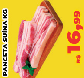
PANCETA SUÍNA KG R$ 16,99