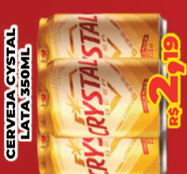
CERVEJA CRYSTAL LATA 350ML R$ 2,19