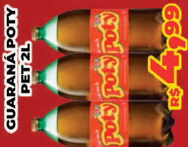
GUARANÁ POTY PET 2L R$ 4,99