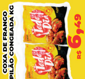
COXA DE FRANGO PILÃO CONGEEADA KG R$ 6,49