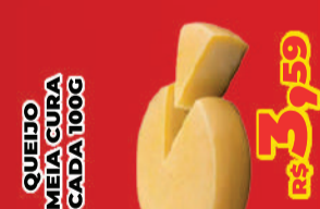
QUEIJO MEIA CURA CADA 100G R$ 3,59