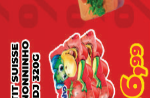
PETTIT SUISE DANONINHO BIDJ 320G R$ 6,99