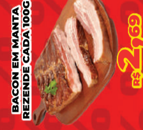
BACON EM MANTA REZENDE CADA 100G R$ 2,69