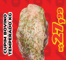
CUPIM BOVINO TEMPERADO KG R$ 27,99