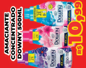
AMACIANTE CONCENTRADO DOWNY 500ML R$ 10,99