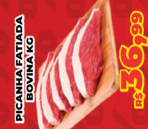
PICANHA FATIADA BOVINA KG R$ 36,99