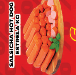
SALSICHA HOT DOG ESTRELA KG R$ 6,99