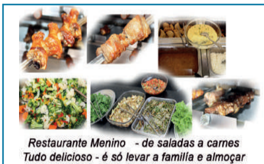
Restaurante Menino - de saladas a carnes Tudo delicioso - é só levar a família e almoçar