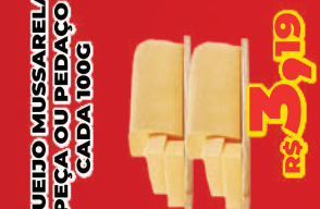
QUEIJO MUSSARELA PEÇA OU PEDAÇÃO CADA 100G R$ 3,19