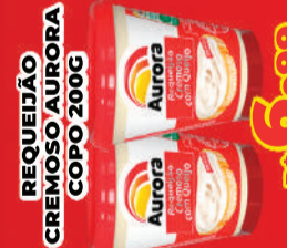
REQUEIJÃO CREMOSO AURORA COPO 200G R$ 6,99