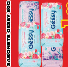
SABONETE GESSY 80G R$ 1,99