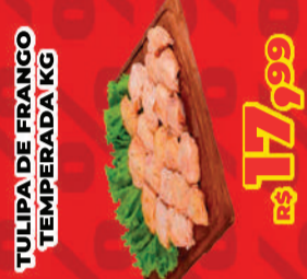
TULIPA DE FRANGO TEMPERADA KG R$ 17,99