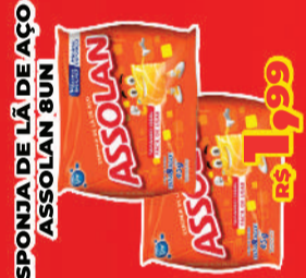
ESPONJA DE LÃ DE AÇO ASSOLAN 8UN R$ 1,99