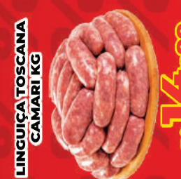
LINGUIÇA TOSCANA CAMARI KG R$ 14,99