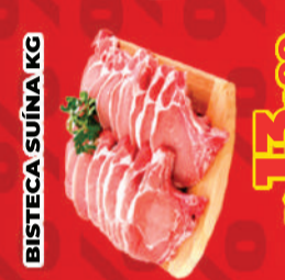
BISTECA SUÍNA KG R$ 13,99