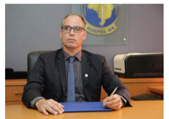
Delegado Rodolfo Laterza, presidente da Adepol do Brasil

Estado - Déficit de Delegados de Polícia - % 1º - RO - 281 (61%) 2º - PA - 495 (48,5%) 3º - PR - 370 (47,4%) 4º - PE - 320 (45,7%) 5º - MG - 800 (44,4%) 6º - MT - 134 (44%)