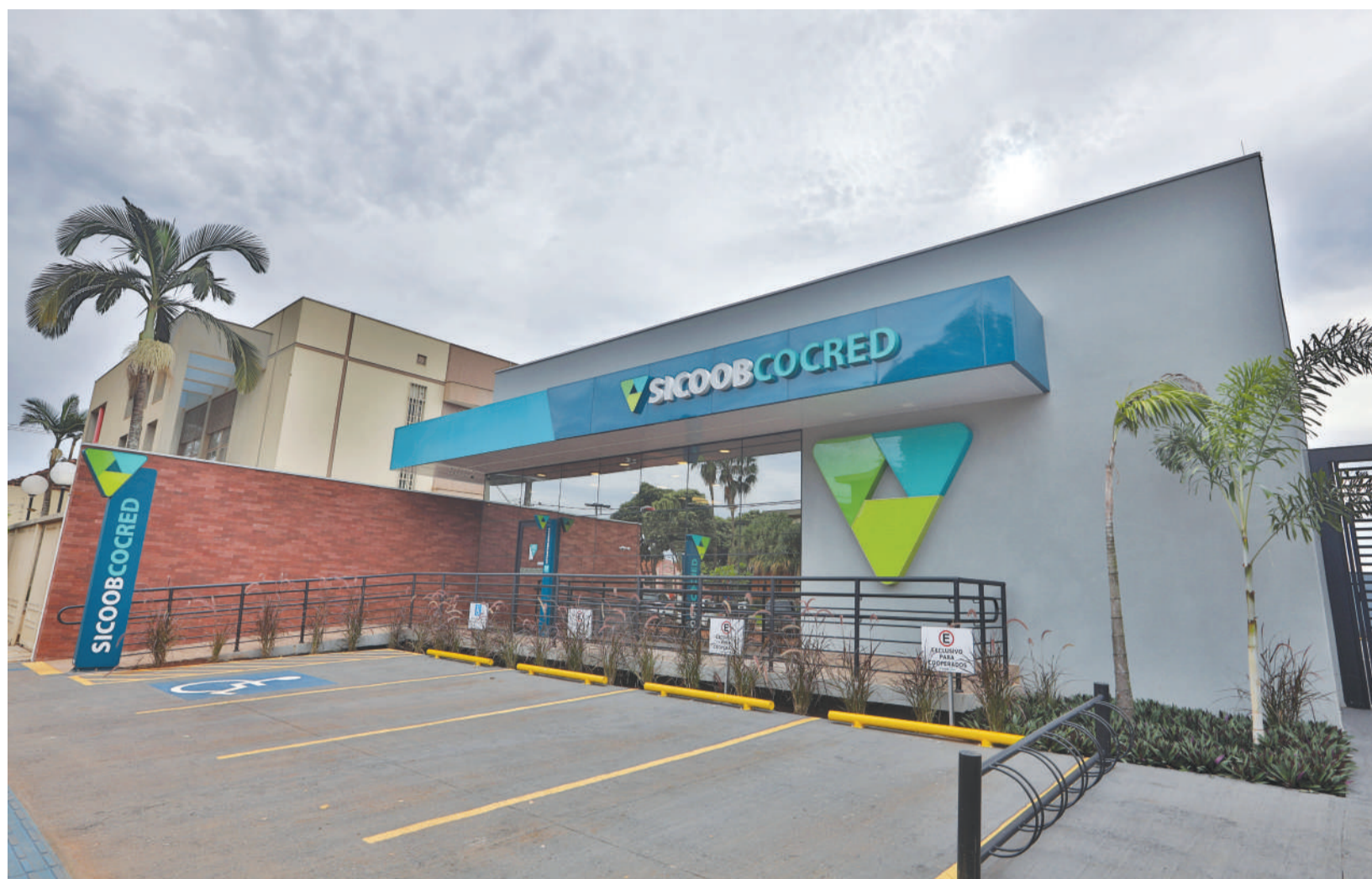
A agência da Cocred em Guaíra é a 39ª da cooperativa, que agora está em 33 municípios

Unidade, que tem sistemas para redução de uso de água e geração de energia solar, reforça atuação da cooperativa no nordeste paulista