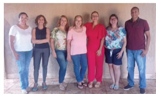
Agenda Cultural realizado pelo Instituto Oswaldo Ribeiro de Mendonça, Ministério da Cultura por meio da Secretaria Especial de Cultura e será executado em parceria com as Secretarias Municipais de Educação e Cultura.