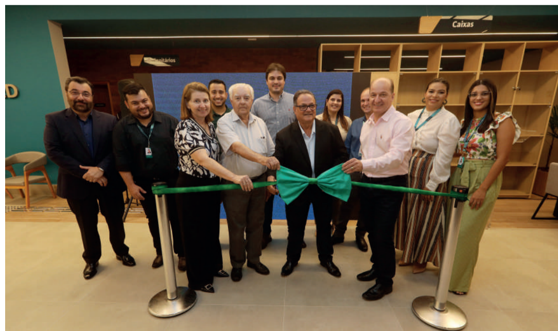
Diretores, colaboradores, cooperados e moradores locais se posicionam para o corte da fita inaugural

Sicoob Cocred – Com mais de 58 mil associados, a Sicoob Cocred é uma das maiores cooperativas de crédito do Brasil em volume de ativos, que, em dezembro de 2022, chegava a R$ 9,7 bilhões. O volume da carteira de crédito atingia R$ 6,1 bilhões. Já a carteira de captações, que soma depósitos em conta corrente e investimentos em Recibo de Depósito Cooperativo (RDC), Letra de Crédito do Agronegócio (LCA) e Letra de Crédito Imobiliária (LCI), era a R$ 6,3 bilhões.