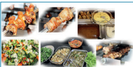
Restaurante Menino - de saladas a carnes Tudo delicioso - é só levar a família e almoçar