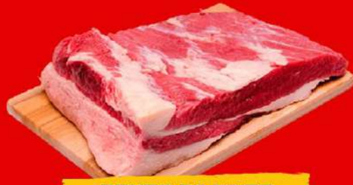
PONTA DE PEITO