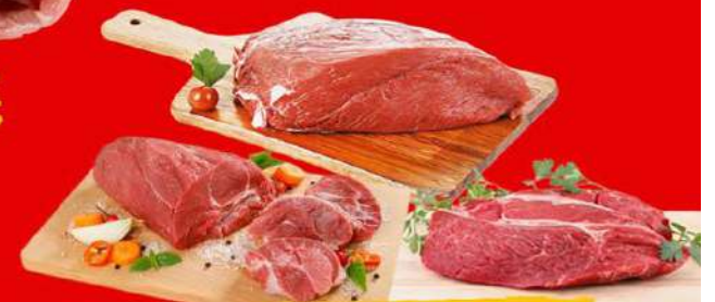
ACÉM, MÚSCULO OU PALETA