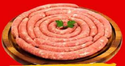
LING. FINA SUINA