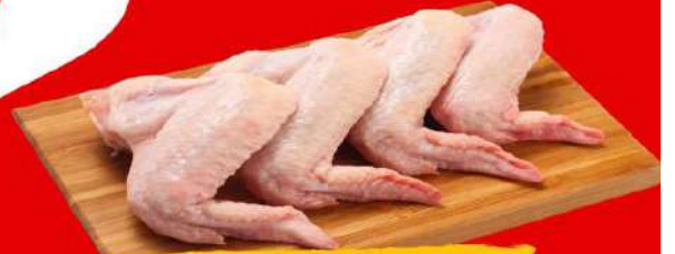
TULIPA COM PONTA