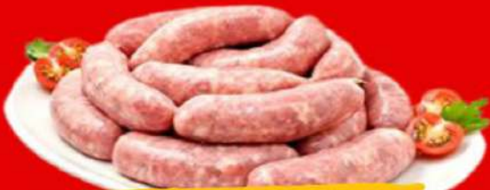
LING. SUINA GROSSA