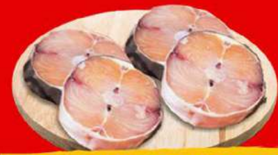
POSTA DE PINTADO