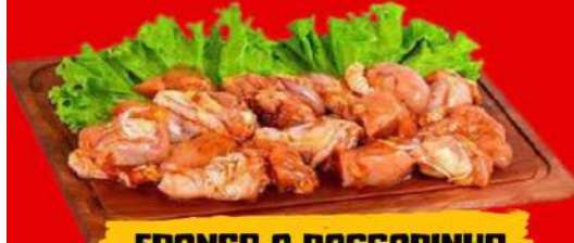
FRANGO A PASSARINHO