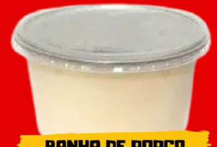
BANHA DE PORCO