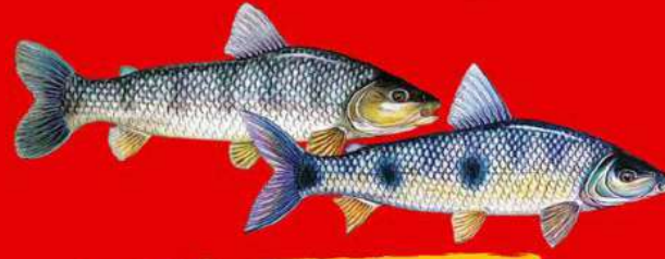
PIAÇU DU PIAPARA