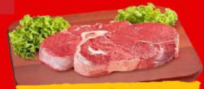
MAÇA DA PALETA