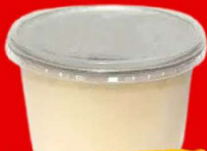
BANHA DE PORCO