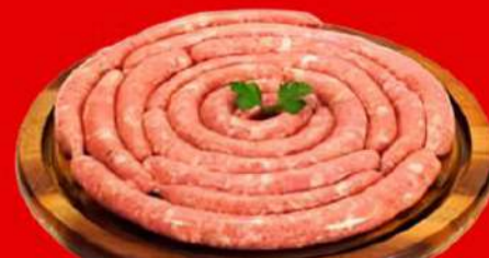
LING. FINA SUINA