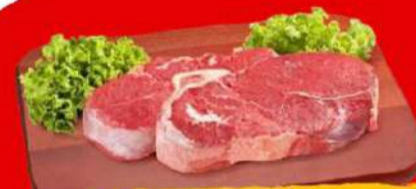
MAÇA DA PALETA