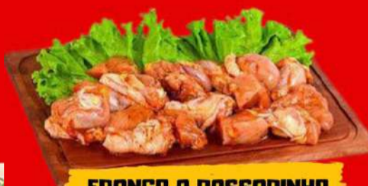
FRANGO A PASSARINHO