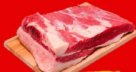
PONTA DE PEITO