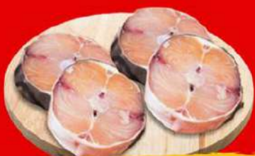
POSTA DE PINTADO