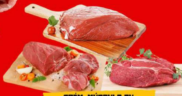
ACÉM, MÚSCULO OU PALETA