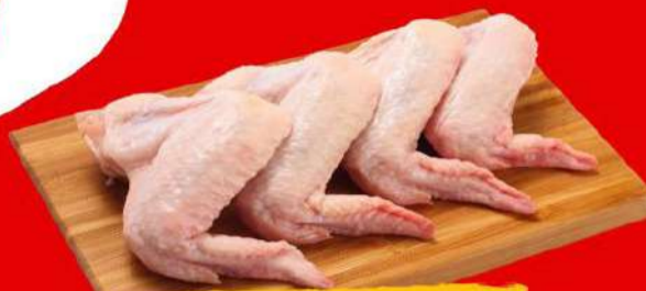
TULIPA COM PONTA