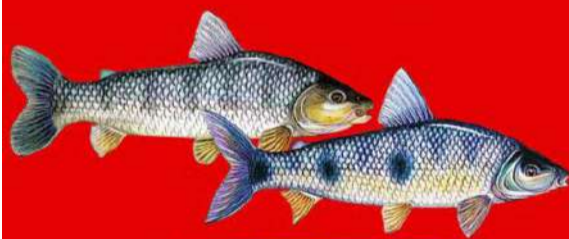
PIAÇU OU PIAPARA

AV.: JOSE FLORES, 284 EM FRENTE A FEIRA GUAÍRA - SP (17) 99224-7314