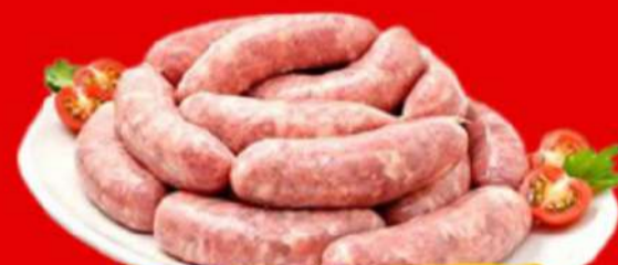
LING. SUINA GROSSA