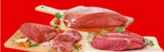
MÚSCULO, AZEITE DA PALETA

OFERTA VÁLIDA ATÉ 31 DE OUTUBRO DE 2024 OU ENQUANTO DURAR O ESTOQUE