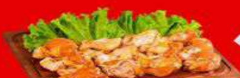
COXINHA NA MOSTARDA