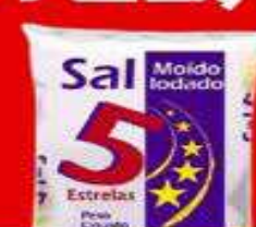
SAL FINO 1 KG