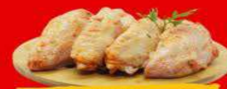
TULIPA NA MOSTARDA