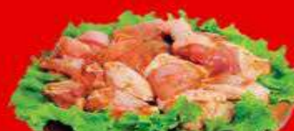
FRANGO A PASSARINHO TEMPERADO