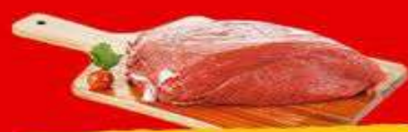
MIOLO DA PALETA