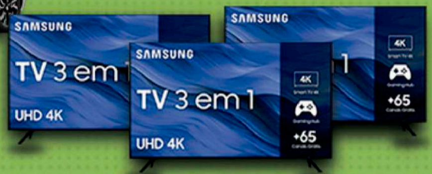
20 SMART TV SAMSUNG 50"