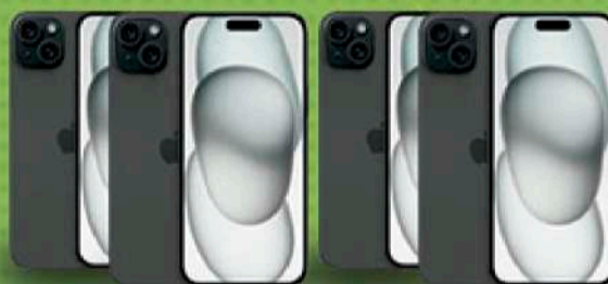
10 iPhone 15