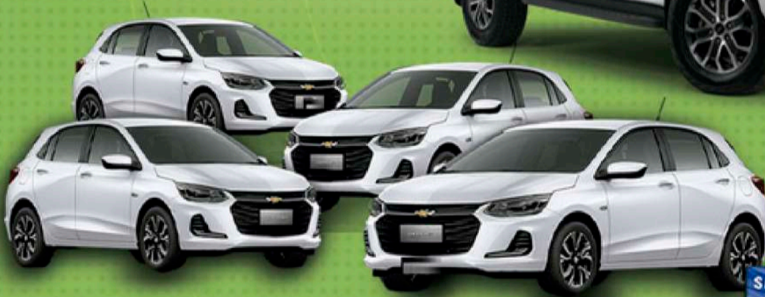
8 CHEVROLET ONIX LT