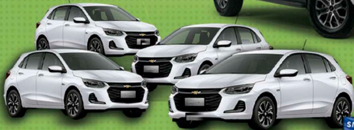
8 CHEVROLET ONIX LT