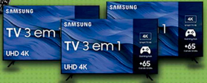
20 SMART TV SAMSUNG 50"