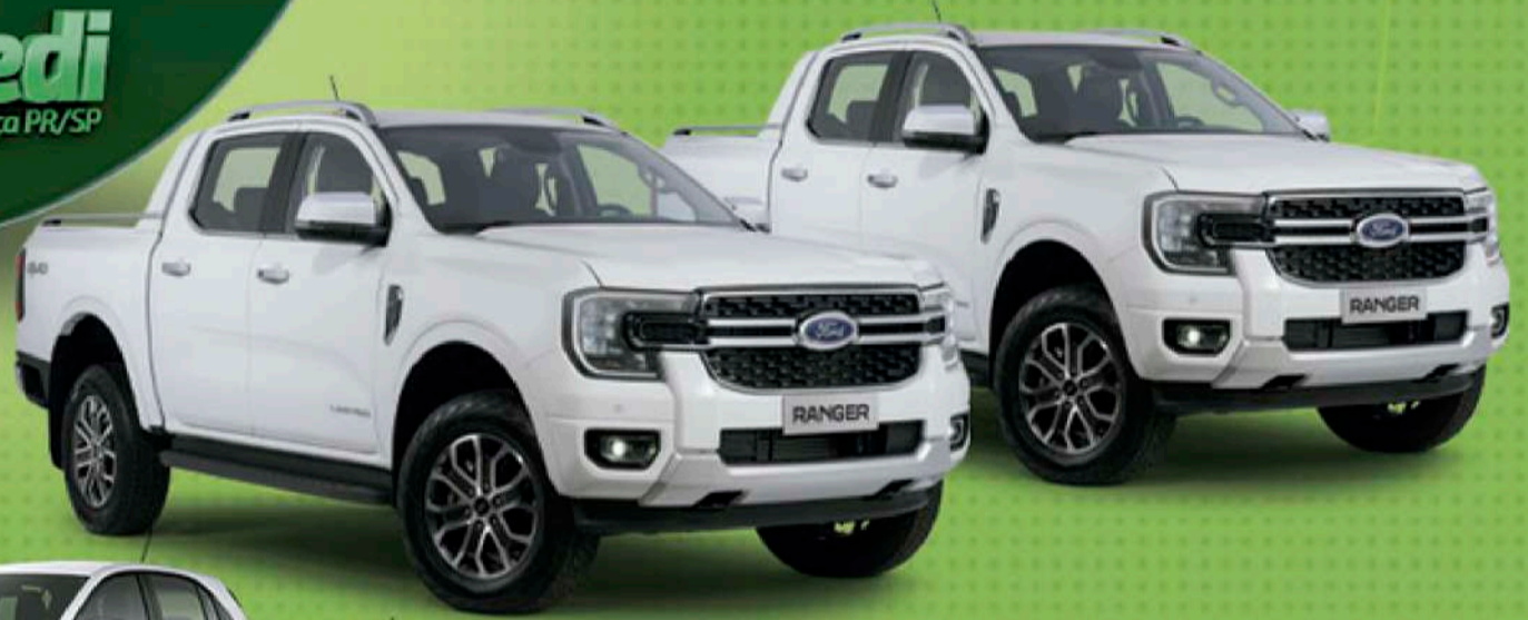
2 FORD RANGER LIMITED 3.0

PROCURE SUA AGÊNCIA SICREDI ALIANÇA PR/SP E PARTICIPE.