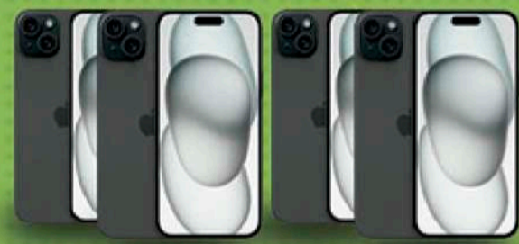
10 iPhone 15