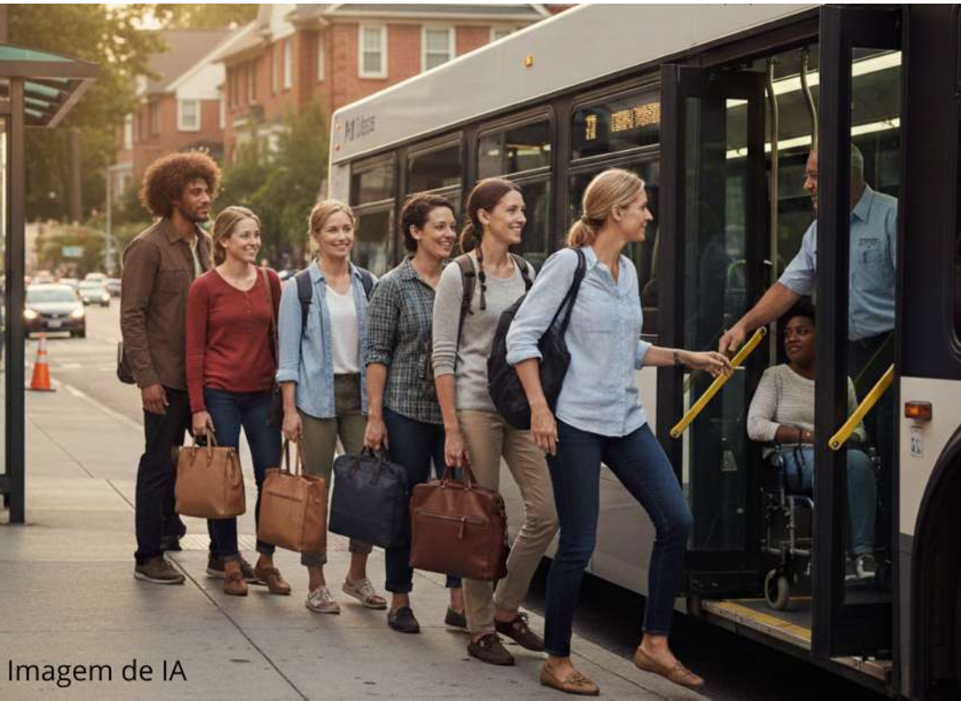
Imagem de IA

A Diretoria Municipal de Educação de Guaíra abre, na próxima segunda-feira (2), as inscrições presenciais para o Auxílio Transporte do primeiro semestre de 2026. O benefício é destinado a estudantes matriculados em cursos técnicos e superiores. Os candidatos têm de 2 a 23 de fevereiro, prazo considerado improrrogável, para entregar a documentação completa na sede da Diretoria. O atendimento será das 8h às 18h. Uma vez que o processo demanda uma quantidade significativa de documentos, a recomendação é que os estudantes não deixem a entrega para a última hora. A lista exigida é rigorosa e inclui cópias de RG, CPF, comprovante de residência atualiza-