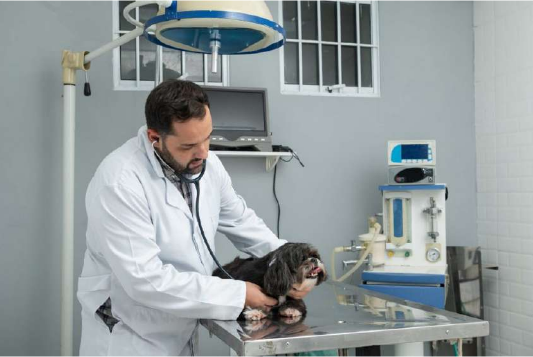
Cada pet contêiner possui 60 m² e estrutura completa de consultório, com capacidade para até 10 atendimentos diários.

Programa já soma 76 unidades instaladas no estado e previsão de instalação de mais 39 até o fim de 2026