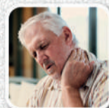
Dores nas articulações