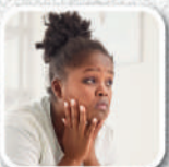
Fraqueza e cansaço