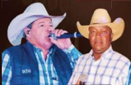
BUFALLO BILL AGUIA NEGRA