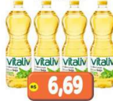
ÓLEO DE SOJA VITALIV 900ML