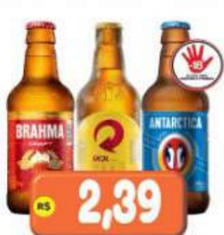
CERVEJA BRAHMA, SKOL OU ANTARCTICA RET. 300ML