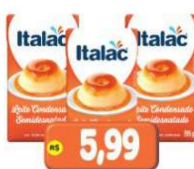
LEITE CONDENSADO ITALAC TP. 395G