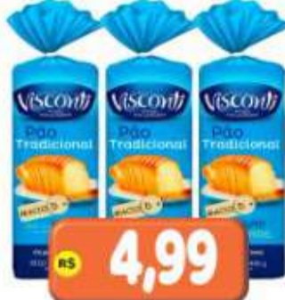
PÃO DE FORMA VISCONTI TRAD. 400G