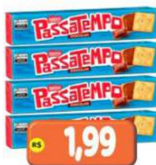
BISCOITO RECHEADO PASSATEMPO CHOC. 130G