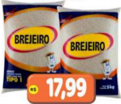
ARROZ BREJEIRO TIPO 1 - 5KG