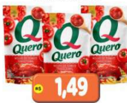
MOLHO DE TOMATE QUERO SACHÊ 240G