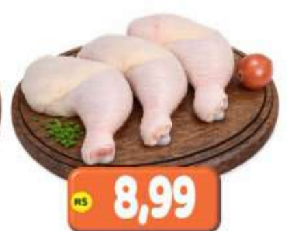
COXA E SOBRECOXA DE FRANGO CONG. KG