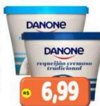
REQUEIJÃO CREMOSO DANONE TRAD. OU LIGHT 200G