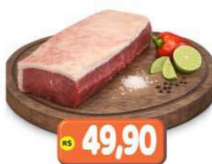
CONTRA FILÉ GRILL KG