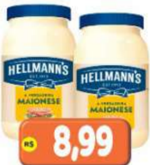
MAIONESE HELLMANN'S TRAD. 500G