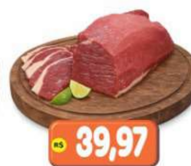
COXÃO DURO BOVINO KG