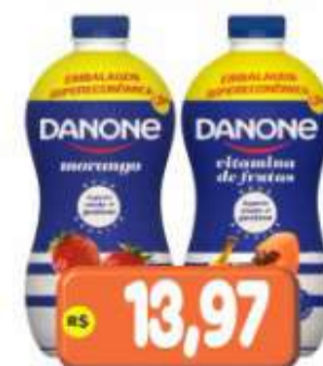
IOGURTE GARRAÇÃO DANONE SABORES 1,25KG