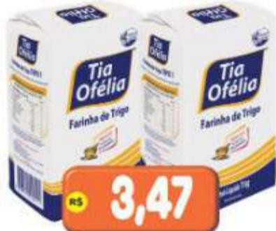
FARINHA DE TRIGO TIA OFÉLIA 1KG