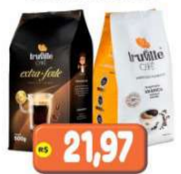
CAFÉ TRUVILLE TRAD. OU EXTRA FORTE 500G