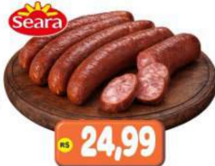
LINGUIÇA TIPO CALABRESA SEARA DEFUMADA KG