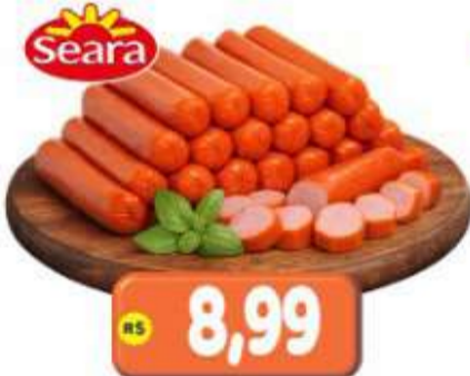
SALSICHA HOT DOG SEARA KG