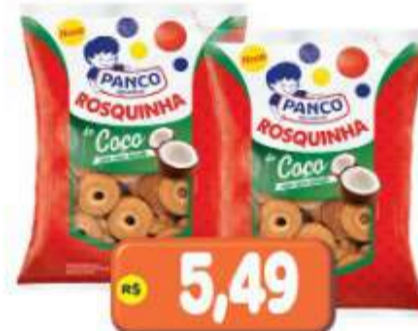
BISCOITO ROSQUINHA DE COCO PANCO 350G