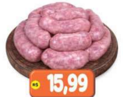
LINGUIÇA TOSCANA SUÍNA REAL KG