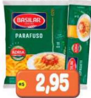
MACARRÃO BASILAR SEMOLA 400G