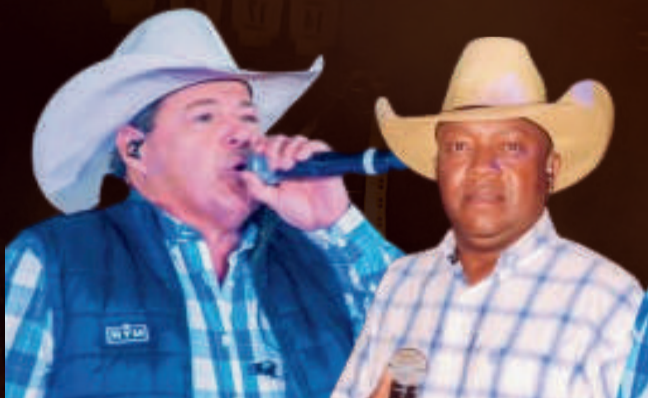
BUFALLO BILL AGUIA NEGRA