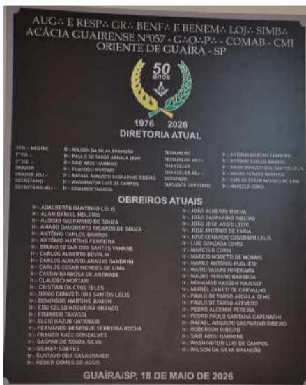
Pág. 11 / 12

A Loja Maçônica Acácia Guairense viveu um dos momentos mais marcantes de sua trajetória no último dia 17 de maio, durante a celebração do Jubileu de Ouro da instituição, que no dia 18 de maio completou oficialmente 50 anos de fundação em Guaíra.