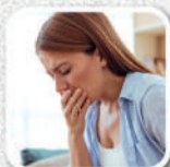
Náusea e vômito