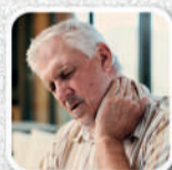
Dores nas articulações