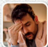
Dor de cabeça e febre alta

É responsabilidade de todos combater o mosquito. Faça sua parte e fique atento aos sintomas!