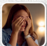
Dor atrás dos olhos

Se persistirem os sintomas procure a Unidade de Saúde da Família (USF) mais próxima.