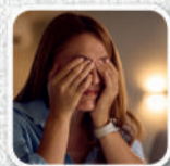
Dor atrás dos olhos

Se persistirem os sintomas procure a Unidade de Saúde da Família (USF) mais próxima.