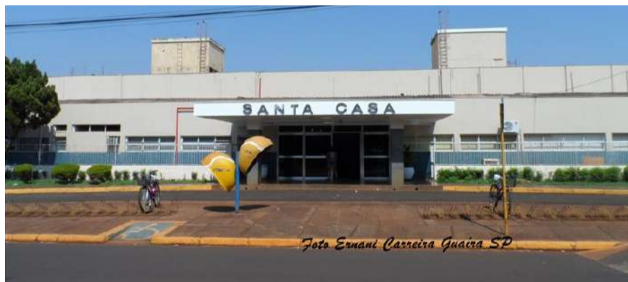
Guaíra SP

Quem passa em frente à Santa Casa de Guaíra durante a madrugada talvez não imagine o quanto a cidade continua acordada lá dentro. Enquanto boa parte das luzes se apaga, outras permanecem acesas o tempo inteiro. É gente entrando com dor, família esperando notícia, profissionais correndo contra o relógio e uma rotina que não conhece feriado, chuva ou horário comercial.