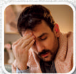
Dor de cabeça e febre alta

É responsabilidade de todos combater o mosquito. Faça sua parte e fique atento aos sintomas!