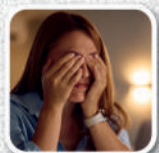
Dor atrás dos olhos

Se persistirem os sintomas procure a Unidade de Saúde da Família (USF) mais próxima.