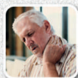
Dores nas articulações