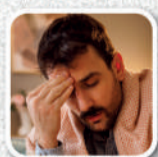
Dor de cabeça e febre alta

É responsabilidade de todos combater o mosquito. Faça sua parte e fique atento aos sintomas!