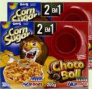
Kit Choco Boll+ Corn Sugar+Tigela