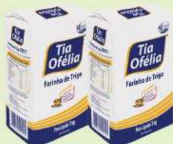
Farinha de Trigo Tia Ofélia 1kg