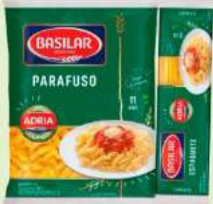
Macarrão Semolado Basilar 400g