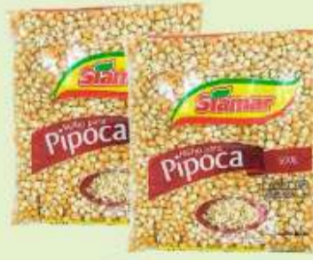
Milho Pipoca Siamar 500g