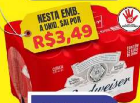
CERVEJA BUDWEISER LATA 350ML PACK C/12 UNID.