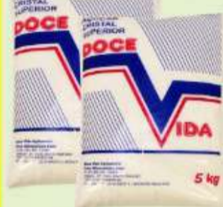
Açúcar Cristal Doce Vida 5kg