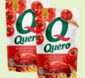
Molho de Tomate Quero Trad. Sachê 240g