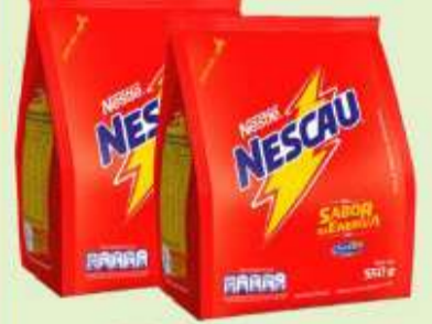
Nescau Actgo Achoc. Pó Sachê 550g