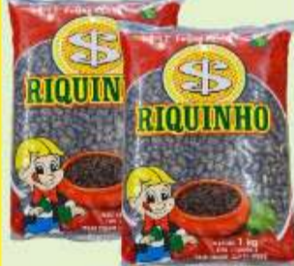
Feijão Preto Riquinho 1kg