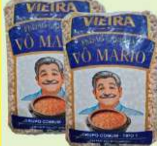
Feijão Carioca Vô Mario 1kg