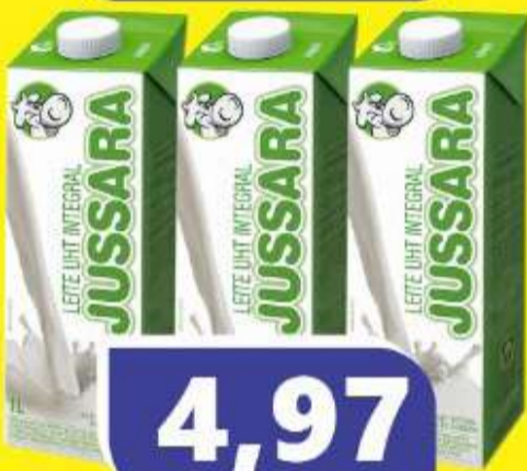
LEITE INTEGRAL JUSSARA UHT 1L