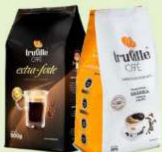
Café Truville Trad. ou Extra Forte 500g