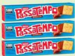
Bisc. Passatempo Rech. Chocolate 130g