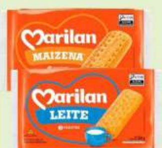
Biscoito Marilan Sabores 300g