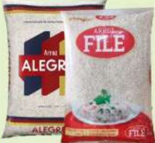
Arroz Alegrete ou Filé Tipo 1 - 5kg