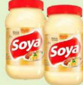
Maionese Caseira Soya 500g