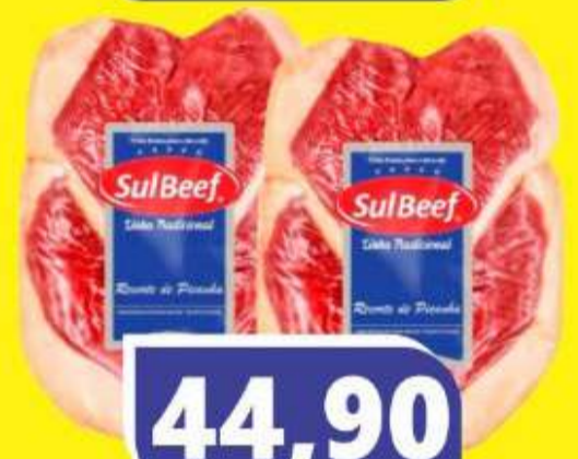
PICANHA FATIADA SULBEEF KG