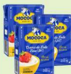
Creme de Leite Mococa Tp. 200g