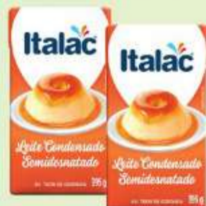
Leite Condensado Italac Tp. 395g