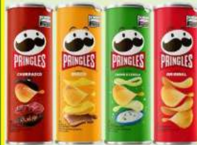
Batata Pringles 104/109g