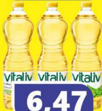
ÓLEO DE SOJA VITALIV 900ML